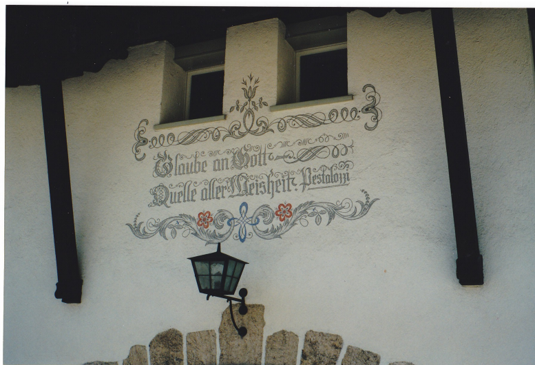
Tekst op een Schulhaus: Glaube an Gott. Quelle aller Weisheit. Pestalozzi.

Aan het sociaal-pedagogisch en onderwijskundig handelen van Pestalozzi lagen verschillende motieven ten grondslag. In zijn streven naar mondigheid, zelfstandigheid en zelfredzaamheid van zijn pupillen, was hij beïnvloed door het denken van de Verlichting en het klimaat van de Franse Revolutie (hij was altijd 'parteiisch fürs Volk'). Maar behalve sociaal-politieke motieven spelen godsdienstige opvattingen eveneens een rol in zijn pedagogiek.