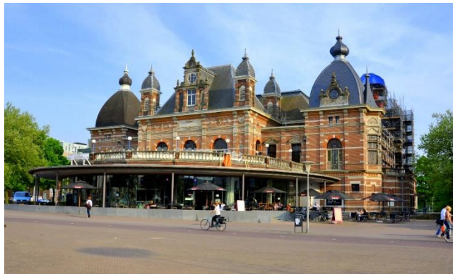
Muis Sacrum in Arnhem