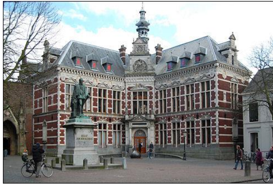
Academiegebouw Universiteit Utrecht